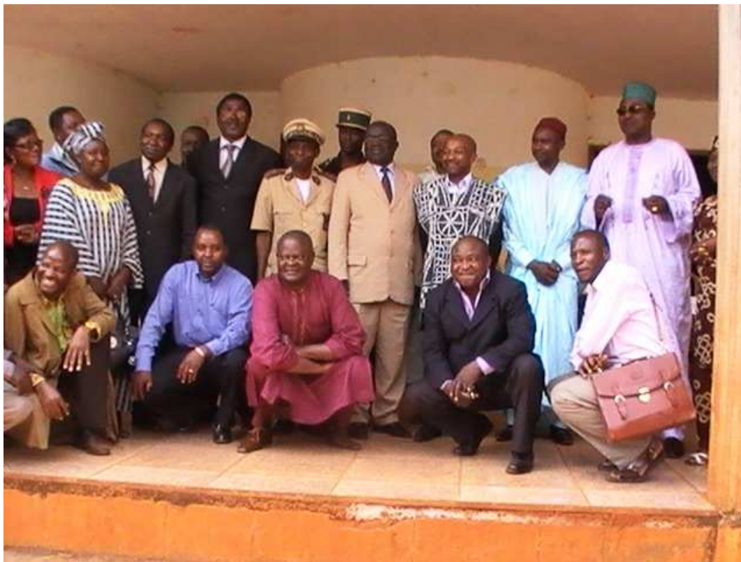
Gruppenphoto nach der offiziellen Spendenübergabe in Baham