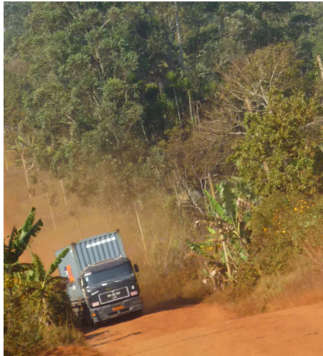
Ankunft der Container in Baham

Einmal in Kamerun wurden die Container nach der Zollabfertigung in Douala nach Baham am 3. Dezember 2009 transportiert.